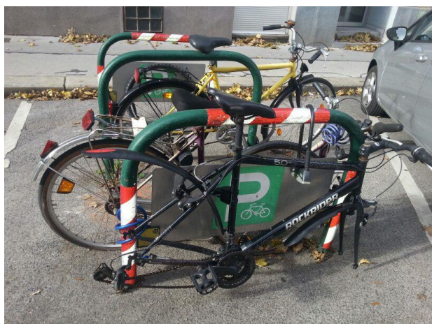
Beispiel für sog. „Fahrradleichen“, aufgenommen in der Keilgasse, 1030 Wien.